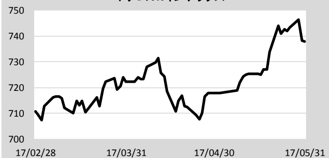
ベトナムVNインデックス