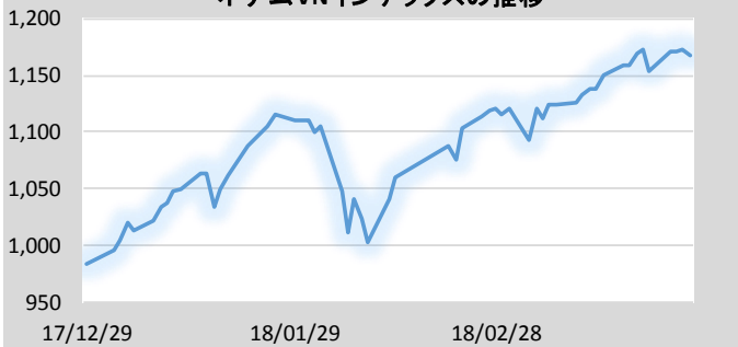
ベトナムVNインデックスの推移