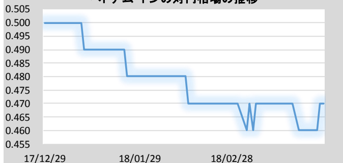
ベトナム・ドンの対円相場の推移

VNインデックスは、ホーチミン証券取引所に上場する全ての銘柄の時価総額加重平均指数です。