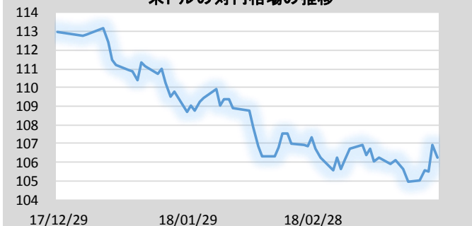
米ドルの対円相場の推移

※ベトナム・ドンの対円相場の推移は、100ベトナム・ドンあたりの数値で、投資信託協会が公表する仲値を使用して表示しています。